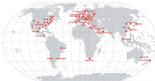
Training Centers Worldwide